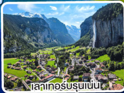
เลาเกอร์บรุนเนน