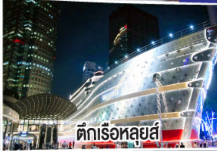
ตึกเรือหลุยส์