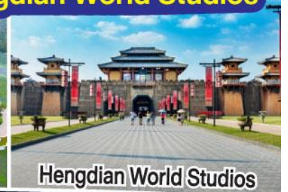
Hengdian World Studios