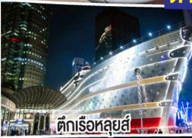
ตึกเรือหุหลู่