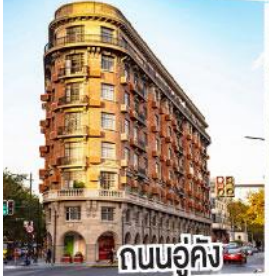
ถนนอู่คิง

ตามรอยซีรีส์จีนที่ Hengdian World Studios