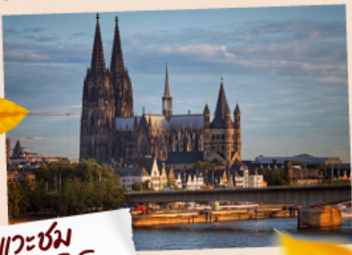
แควซ่ม มหาวิหารโคโลญ