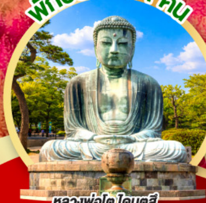
หลวงพ่อโต โดบุตสึ