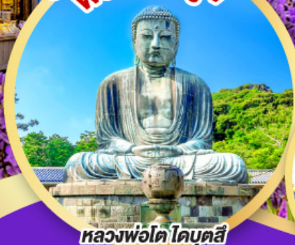
หลวงพ่อโต ไคบุตสึ