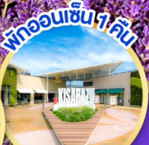
มิตซูเอะอิเกะอิชิอิ พาร์ค คิซะระซู