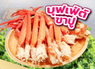
บุฟเฟ่ต์ 3 อย่าง