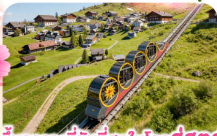
ขัั้นรรางที่ชันที่สุดในโลกสู่สตูล

พีชียอดเขาชุนเนกกา 1 ในเขาที่สวยงามที่สุดเมืองเซอร์แมท