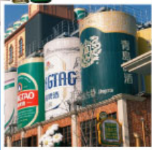
พิพิธภัณฑ์โรงเบียร์ซิงเต่า