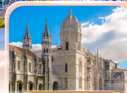
มหาวิหารเซวิลล์