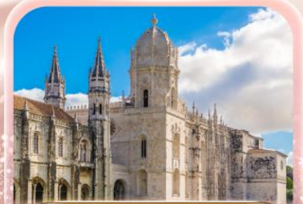
มหาวิหารจอร์นโบ