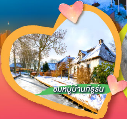
ชมหมู่บ้านกิธูร์น