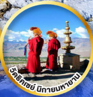
วัดริคชีย์ นิกายมหายาน