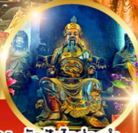
วัดปิกโตฮองฮำ