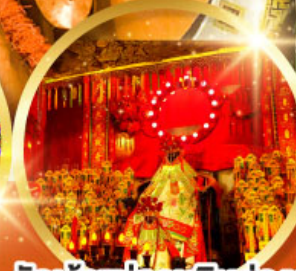
วัดเจ้าแม่กวนอิมฮองฮำ (สวนหนานหลิน)