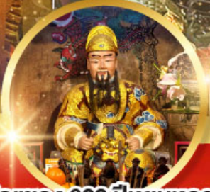
วัดแซกง 600 ปี หุ่นทอง