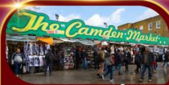
ตลาดแคมเดน