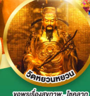
วัดหยวนทวยวน