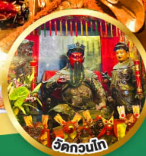
วัดกวนโก