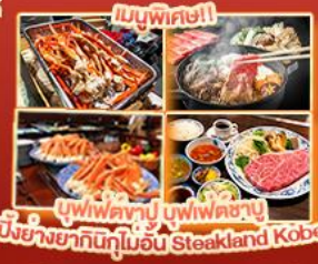
บุฟเฟ่ต์ญี่ปุ่น สเต็กคินโอบี Steakland Kobe