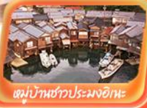
หมู่บ้านชาวประมงอิเกะ