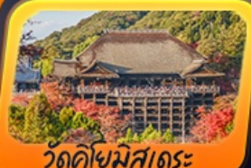
วัดคิโยมิสุเดระ