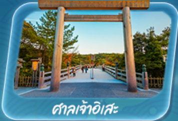
ศาลเจ้าอิสะ

12 - 17 พ.ค. 69 / 19 - 24 พ.ค. 69 26 - 31 พ.ค. 69 / 2 - 7 มิ.ย. 69 9 - 14 มิ.ย. 69