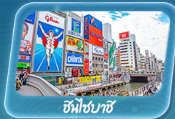
ชินไซบาชิ