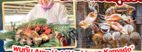
พบกับ Ama Hut "Haohiman Kamado" เมนูพิเศษ SEAFOOD

✈️ สายการบิน AirAsia X (XJ) น้ำหนักกระเป๋า 20 KG