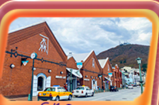
โค้งอิฐแดง