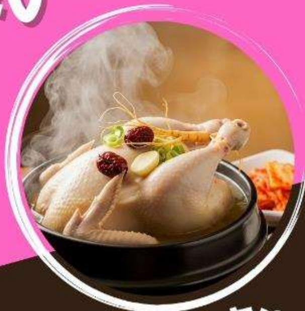
ซัมกเขทัก