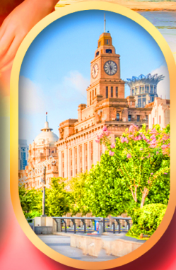
หาดไวกาน