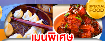
เมนูพิเศษ เสี่ยวหลงเปา หมูน้ำแดง เดินทาง ต.ค. 69 - มี.ค. 70