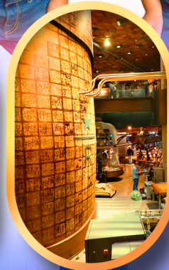
ร้านสตาร์บัคส์