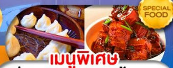
เมนูพิเศษ เสี่ยวหลงเปา หมูน้ำแดง เดินทาง ต.ค. 69 - มี.ค. 70