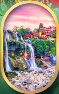
ฟูหลงเจินน้ำตก