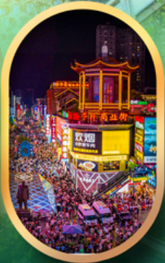
ถนนคนเดินซิงลู่