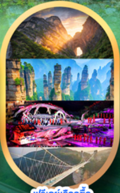
ฟรีคีย์เลือกซื้อ Option เสริม