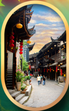
เมืองโบราณฟูหลงเจิน