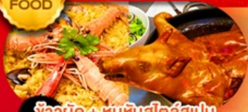
ข้าวผัด + หมูหันสไตล์สเปน