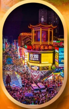
ถนนคนเดินซิงลู่