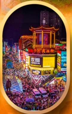
ถนนคนเดินซิงลู่