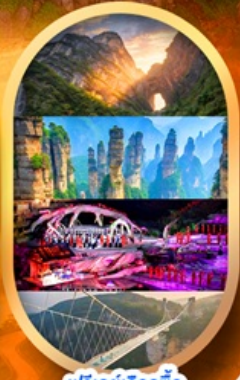
ฟรีเดย์เลือกซื้อ Option เสริม