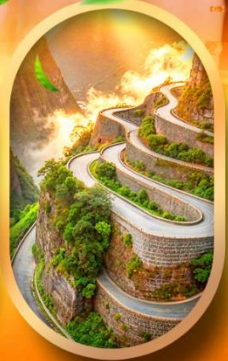
หุบเขาปายจาง