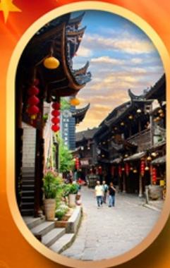
เมืองโบราณฟูหรงเจิน