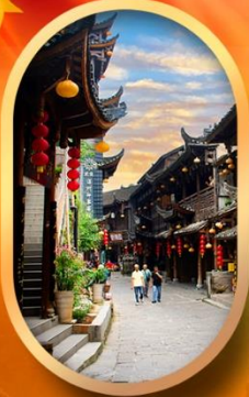
เมืองโบราณฟูหลงเจิ้น