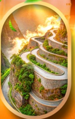
หุบเขาปายจ้าง