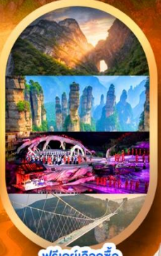
ฟรีเดย์เลือกซื้อ Option เสริม