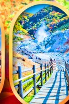
หุบเขานรกจิกุคุดานิ