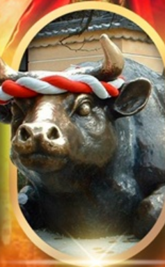
ศาลเจ้าคาซาฟู