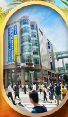
ช้อปปิ้งย่านเท็นจิน