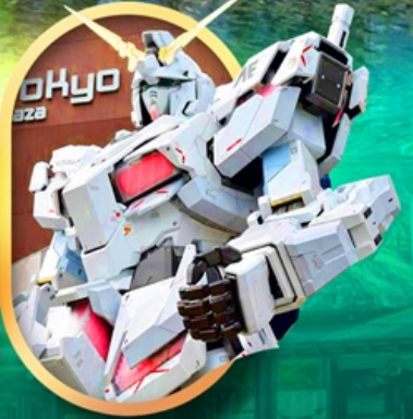
ห้างไอโดะกันดั้ม