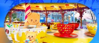
Fuji q Highland x Butterbear เดินทาง พ.ค. 69 เป็นต้นไป