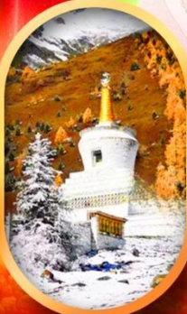
อุทยานสีดรุณี