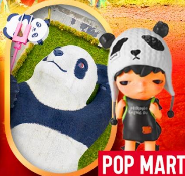
หมีแพนด้าเซลฟี