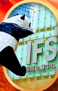
IFS หมีแพนด้าปีนตึก