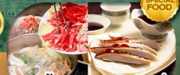
เมนู: สุกี้มองโก + เปิดปักกิ่ง เดินทาง เม.ษ. - ต.ค. 69