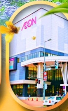
อ็อนมอลล์