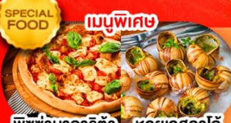
พิซซ่ามาริตต้า หอยแครงสด