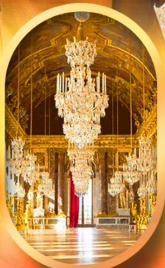
พระราชวังแวกทิกัน