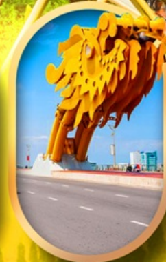
สะพานมังกรดามัง