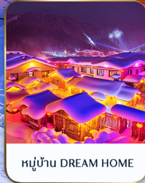
หมู่บ้าน DREAM HOME