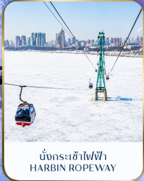
นั่งกระเช้าไฟฟ้า HARBIN ROPEWAY

ธันวาคม - มกราคม 2570 เริ่มต้น 44,989 บาท