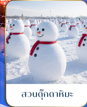
สวนตุ๊กตาหิมะ