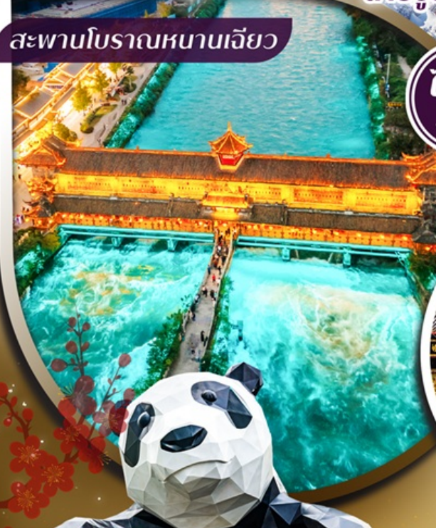
สะพานโบราณหนานเจียว

ชมความงดงาม สะพานโบราณหนานเจียว ระดับ 5A ลักการะ วัดต้าสือ ถ่ายรูปแลนด์มาร์คดัง แพนด้ายักษ์เชลฟี และ แพนด้าป็นตึก