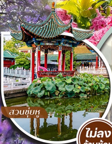
สวนชื่อยุ่