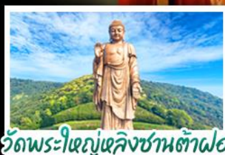
วัดพระใหญ่เฉิงชานต้าฝอ