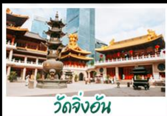
วัดจิ้งอัน