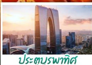
ประตูบูรพาทิศ