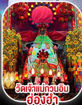
วัดเจ้าแม่กวนอิม ฮ้องฮ้า