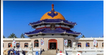
สุสานเจกิสข่าน