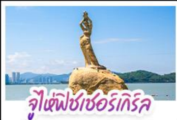
จูเซีฟิซเซอร์ทึกรึค