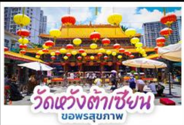
วัดเซ่งต้าเซียง บอพรสุภภาพ