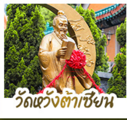
วัดเว่งต่าเซียง