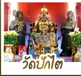
วัดป๊กโต