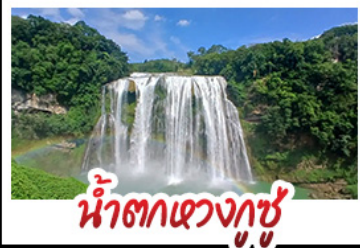
น้ำตกเขวงกู่ชู่

สะพานหุบเขาชาววาเจียง สะพานแขวนที่ยาวที่สุดในโลก ปราสาทจี้หลงเป่า - หมู่บ้านแม้วอูเจียงจ้าย กุ้ยหยางชมทุ่งดอกไม้สตาร์ดและดอกซากุระ ล่องเรือทะเลสาบหวิ้นเฟิงหู - น้ำตกหวงกู่ชู่ พักโรงแรมระดับ 4 ดาว - ชมห่อเจียวฮิวโหลว เมนูปลาต้มซูปเปริยาว - ไม่ลงร้านช้อปปิ้ง