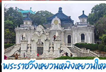
พระราชวังเฉวหนเหมิงเฉวหนี่เหม่