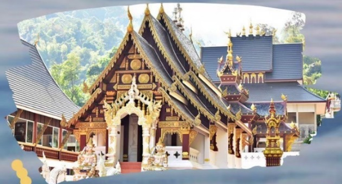
วัดท่าเซตวัน

2 ท่านขึ้นไป 8,400 บาท/ท่าน (เพื่อฟรีวีซ่า 10,599)