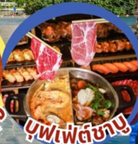
บุฟเฟ่ต์ชาบู