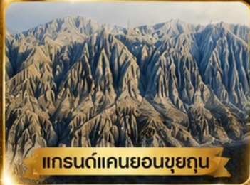
แกรนด์แคนยอนขุยถุน