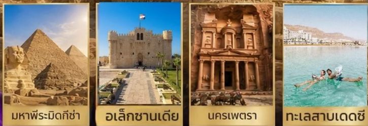
มหาพีระมิดกิซ่า