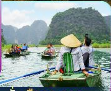
นั่งเรือกระจาด