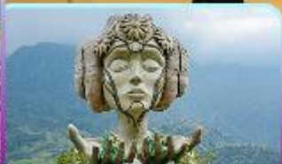
Moana Sapa Cafe