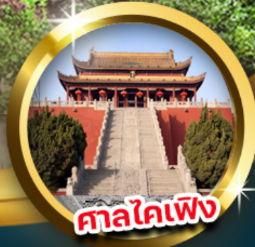
ตาดไท่เฟิง