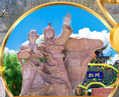
เมืองโบราณขงฟาน