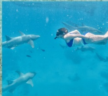
Nurse Shark Snorkeling